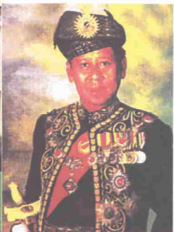
Sultan Abdul Hamid

Hanya sedikit sahaja jawatan yang dipegang oleh orang Inggeris. Sultan Badlishah mangkat dalam tahun 1958.