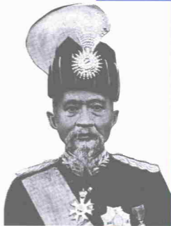
Sultan Abdul Hamid

Sultan Abdul Hamid Shah telah ditabalkan sebagai Sultan Kedah menggantikan Sultan Zainal Rasyid. Pertabalan baginda ini berlangsung pada tahun 1882. Sultan Abdul Hamid seorang sultan yang bijaksana dan berfikiran luas. Semasa pemerintahannya, baginda telah melawat beberapa negara jiran seperti Siam dan Burma. Malangnya baginda sering gering dan pemerintahan negeri Kedah terpaksa diserahkan kepada pemangku Sultan.