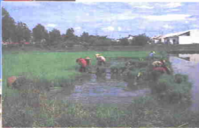
Penanaman Padi di dataran Kedah-Perlis

terletak sebuah kawasan yang dinamakan Lembah Bujang. Banyak peninggalan sejarah telah dijumpai di sini. Sebagai salah sebuah kawasan peninggalan zaman purba, di tempat ini telah didirikan sebuah muzium arkeologi yang dinamakan Muzium Lembah Bujang.