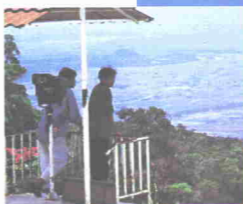
Pemandangan dari Gunung Jerai

alamat kerajaan untuk menjayakan projek Tahun Melawat Malaysia. Setakat ini PKNK telah menyiapkan tujuh chalet dan 24 bilik di kawasan pelancongan Gunung Jerai. Selain itu, sebuah hotel 55 bilik telah dibina di Sungai Petani dan dikenali sebagai Sungai Petani Inn.