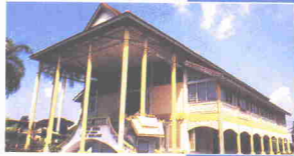
Muzium Negeri Kedah

iaitu di Lebuhraya Darul Aman. Antara bahan-bahan sejarah yang dipamerkan di muzium ini adalah contoh bunga emas yang dijadikan ufti pada suatu ketika dahulu. Di luar bangunan ini pula, dipamerkan alatan pertanian tradisional, kereta bomba lama dan perahu-perahu lama yang penting dalam sejarah negeri Kedah.