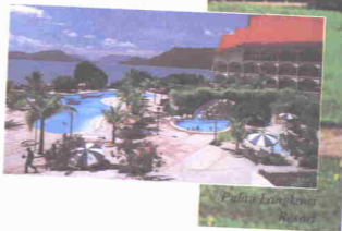
Pulau Langkawi Kedah