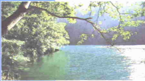
Tasik Dayang Bunting

kedua terbesar di gugusan Pulau Langkawi. Di pulau ini terdapat sebuah tasik air tawar yang sangat terkenal.